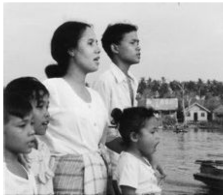
⑩ よみがえる母のうた—インドネシアの結核予防—