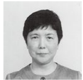
桜映画社プロデューサー