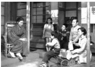
①お母さんの しあわせ 幸福

この映画は、ある結核患者の手術後の抜糸から集団体操にいたる肺機能訓練療法の個人指導を記録して、社会復帰するまでを紹介。当時、結核予防会保生園（東