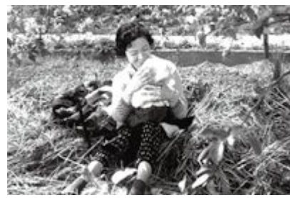
⑥小さな灯をまもる人びと