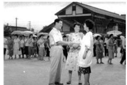
③たくましき母親たち